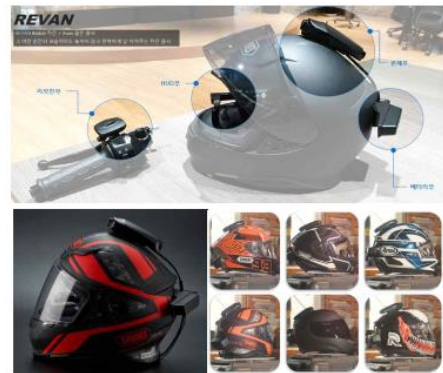
<특히 적용된 기술제품>